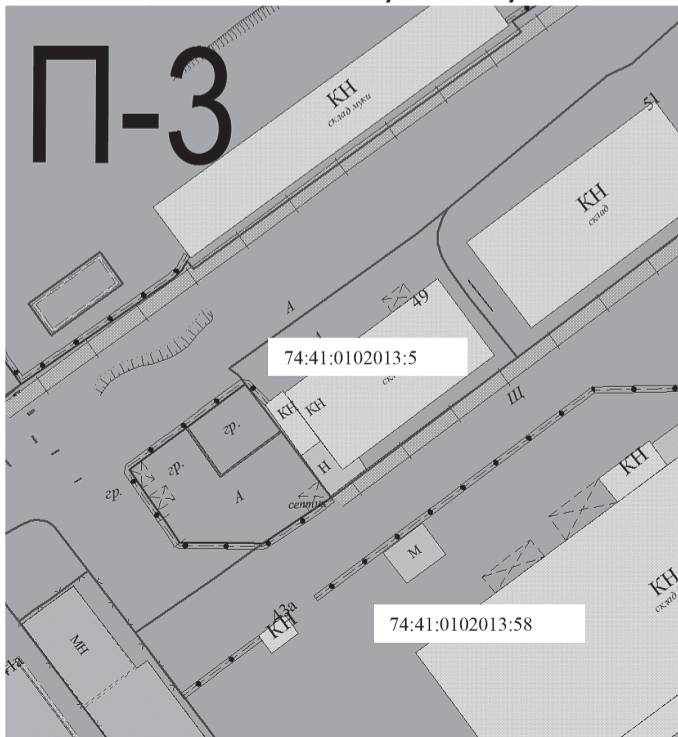
П-3 - территориальная зона производственно-коммунальных объектов III класса вредности

Графическое изображение фрагмента Карты градостроительного зонирования Правил землепользования и застройки в городе Озерске (статья 50) Земельный участок по ул. Монтажников, 49