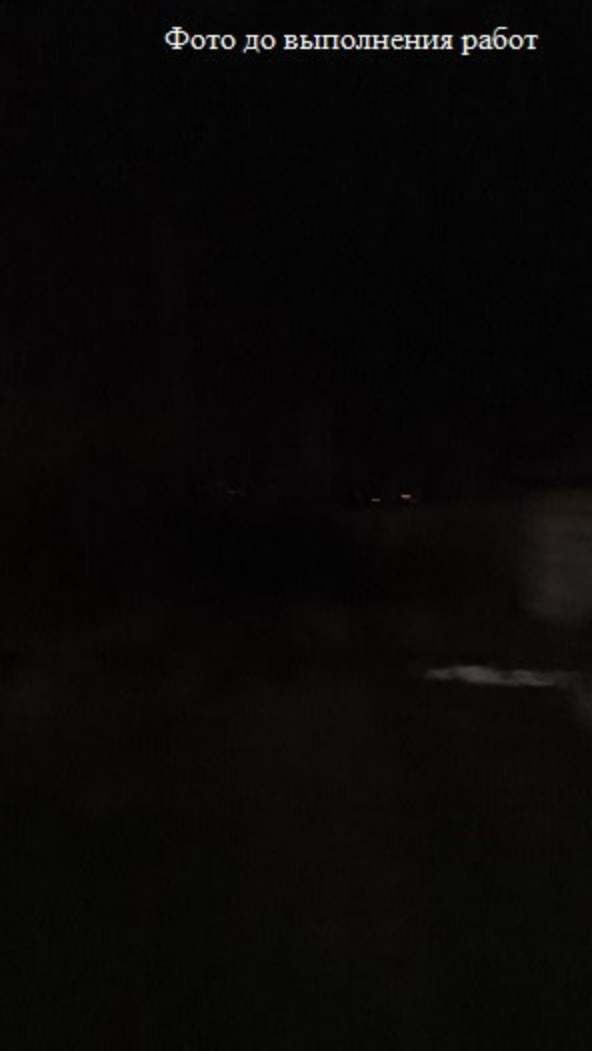
Фото до выполнения работ