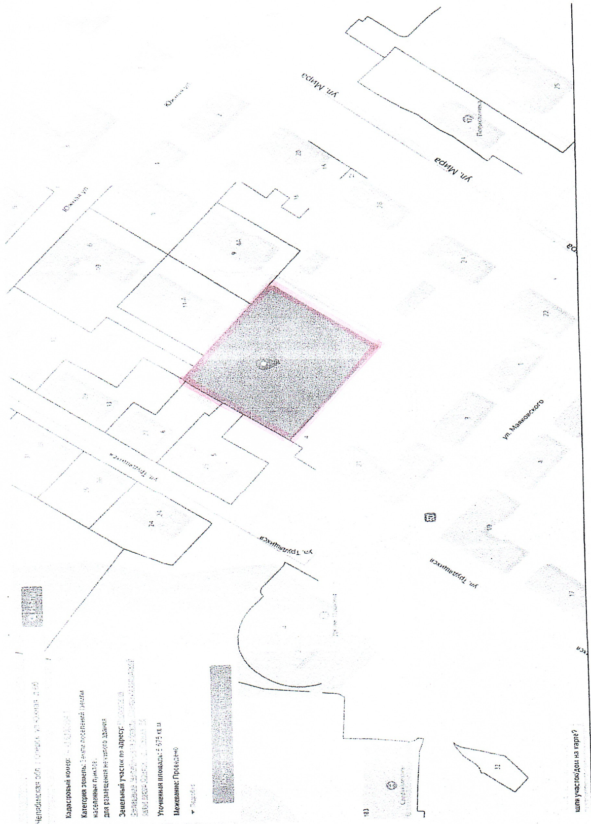
Схема и описание границ предполагаемой части территории

Приложение к письму Главе Озерского городского округа от 23.09.2024 № 267/01-01-15