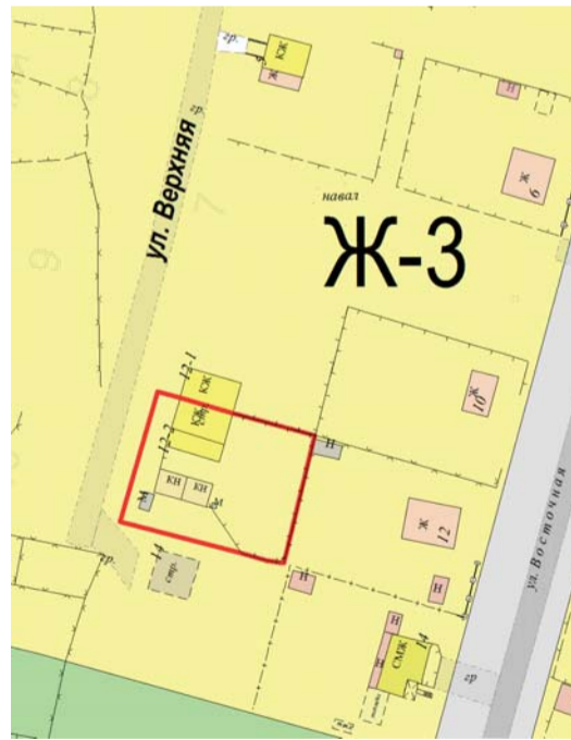
Ж-3 - зона застройки индивидуальными жилыми домами

земельный участок по ул. Верхняя, д. 12, кв. 2