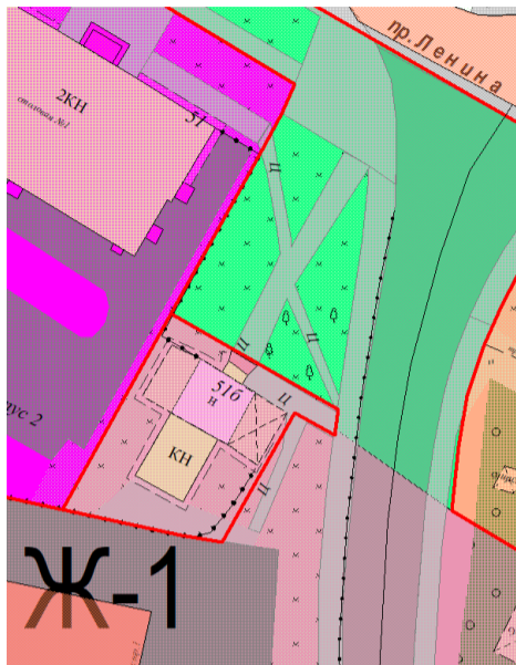
Ж-1 – зона застройки многоэтажными жилыми домами

Объект капитального строительства с кадастровым номером 74:41:0101021:151, расположенный по адресу: Российская Федерация, Челябинская область, Озерский городской округ, город Озерск, пр. Ленина, 516