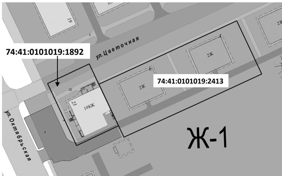
Ж-1 - территориальная зона застройки многоэтажными жилыми домами

Земельный участок с кадастровым номером с кадастровым номером 74:41:0101019:2413 по адресу: Российская Федерация, Челябинская область, город Озерск, улица Цветочная, дом 4, б