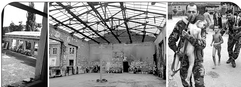
Из этого окна пулемет террористов поливал свинцом детей, разбежавшихся после взрыва в спортзале.

Но именно это и нужно было террористам: чем больше ужаса, тем легче добиться своего. Они знали, что за стенами школы мечутся обезумевшие от горя родственники заложников. Они видели из окон, что отцы захваченных детей рвутся к оружию. Все это воздействовало на власти, заставляло их лихорадочно искать выход из ситуации. Ведь власти понимали, что они не должны принимать условия террористов. Но еще лучше они понимали, что не имеют права допустить гибели заложников!