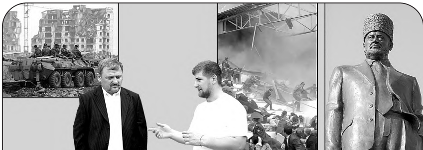
Так выглядел Грозный в 1995 году

И Ахмад Кадыров в 2004 году был убит террористами во время праздничного парада ко Дню Победы на стадионе в Грозном. За что? Он срывал их планы.