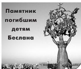
Памятник погибшим детям Беслана

Так почему же террористов называют словом «нелюди»?