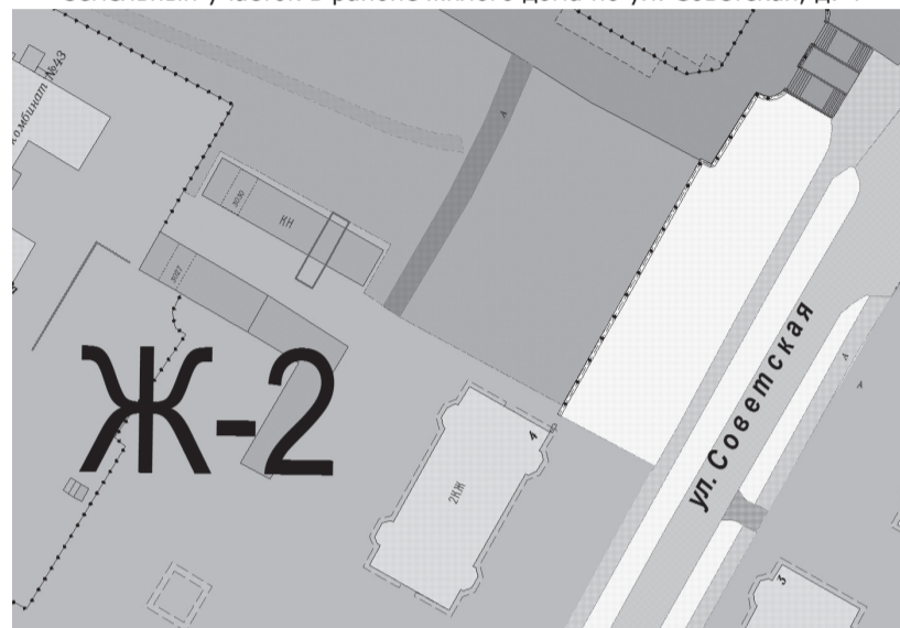
Ж-2 - территориальная зона застройки малоэтажными и среднеэтажными жилыми домами

земельный участок в районе жилого дома по ул. Советская, д. 4