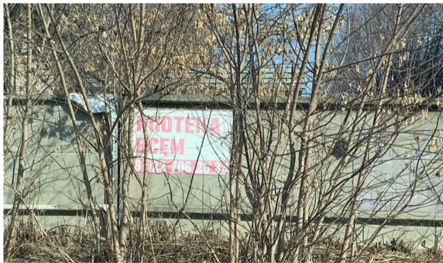
Приложение № 3