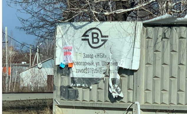
Приложение № 1