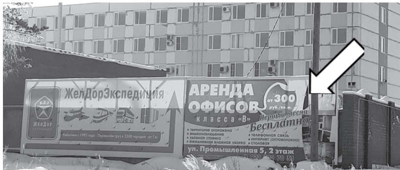
Фотофиксация рекламной конструкции.