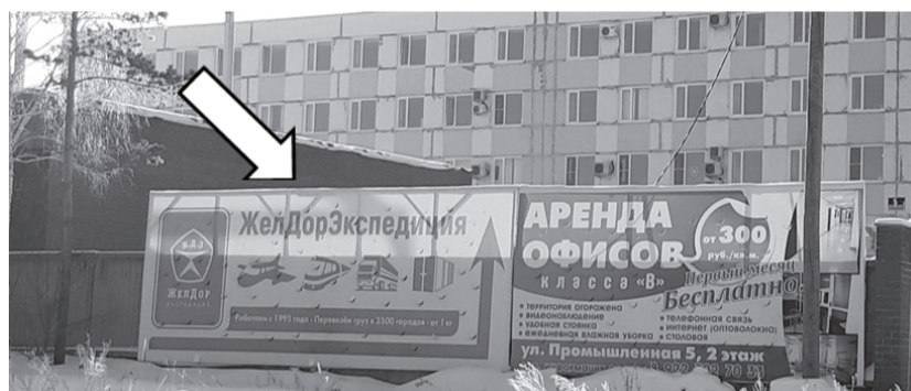
Фотофиксация рекламной конструкции.

Собственнику рекламной конструкции 12.03.2021 № 29-03-18/458