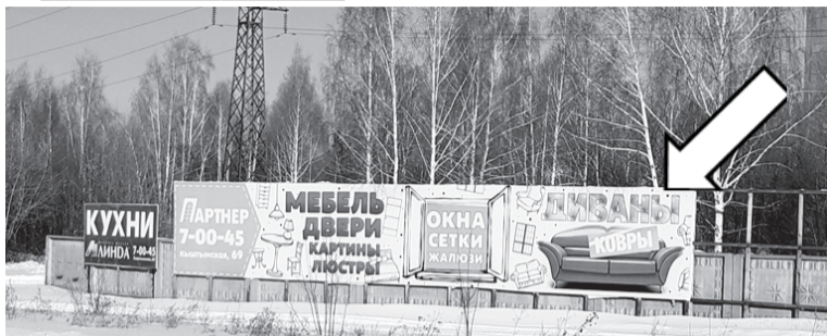
Фотофиксация рекламной конструкции.

Собственнику рекламной конструкции 17.03.2021 № 29-03-18/497