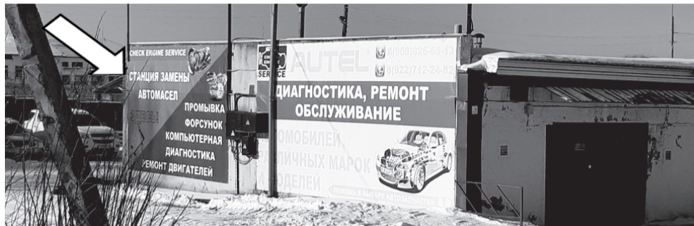
Фотофиксация рекламной конструкции.

Собственнику рекламной конструкции 12.03.2021 № 29-03-18/460