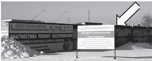
Фотофиксация рекламной конструкции.

Собственнику рекламной конструкции 17.03.2021 № 29-03-18/494