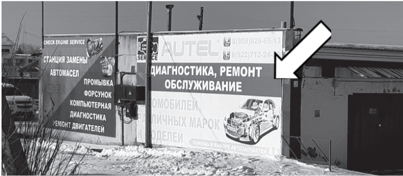
Фотофиксация рекламной конструкции.

Собственнику рекламной конструкции 12.03.2021 № 29-03-18/461