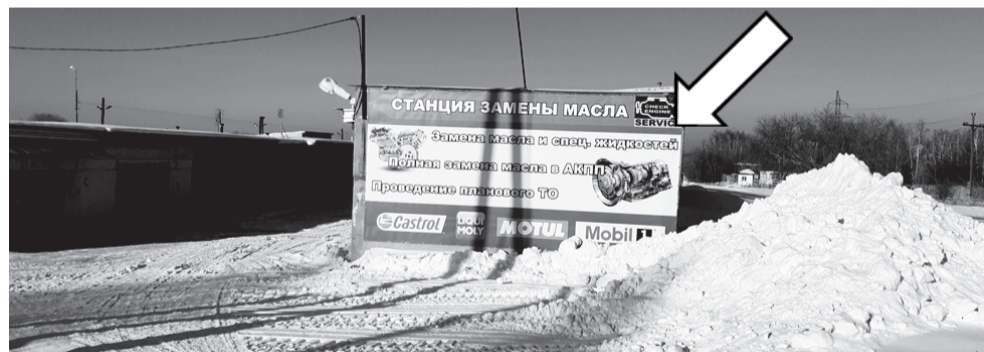
Фотофиксация рекламной конструкции

Собственнику рекламной конструкции 12.03.2021. № 29-03-18/457