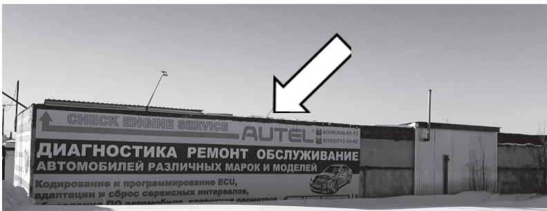
Фотофиксация рекламной конструкции.

Собственнику рекламной конструкции 17.03.2021 № 29-03-18/499