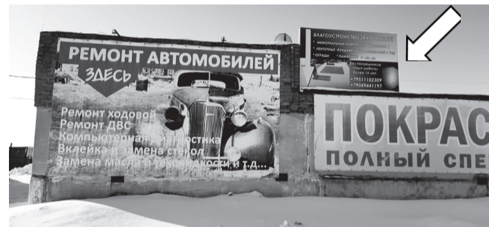
Фотофиксация рекламной конструкции.

Собственнику рекламной конструкции 17.03.2021 № 29-03-18/499