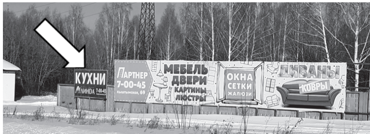
Фотофиксация рекламной конструкции.

Собственнику рекламной конструкции 17.03.2021 № 29-03-18/498